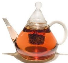
מסננת ביתית מסננת שכל חומר מונח בכלי אחר